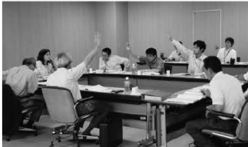
▲甲子園のような熱い闘いが…。事務事業点検風景

昨年に続き、今年も事業仕分け（事務事業点検）が行われます。国や全国の自治体の事業仕分けで実績のある政策シンクタンク「構想日本」の協力を得て、公募市民とともに、40事業を点検します。限られた財源の有効活用を図るためにも、ムダを廃し、将来のためのグランドデザインを描かなければなりません。昨年と同様、白熱した議論を期待しています。傍聴申込みの必要もありませんので、お気軽にお越しください。