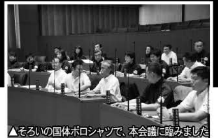
▲そろいの国体ポロシャツで、本会議に臨みました

来年（平成25年）、東京で54年ぶり3度目の国体が開催され、味の素スタジアムで、開・閉会式が行われます。また、府中市が会場となる競技は、下記の通りです。